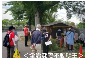
<全治なで不動明王>