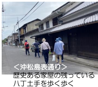
<沖松島表通り> 歴史ある家屋の残っている八丁土手を歩く