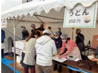
うどんやキッチンカー。 飲食も好評でした。