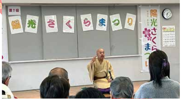
スペシャルゲスト、こけ枝師匠！