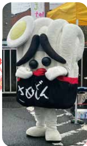
うどんの妖精♪さぬどん