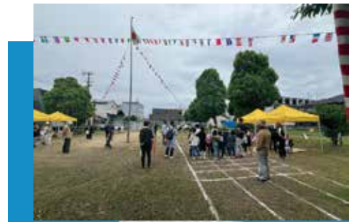
福岡町中央・沖松島合同運動会 5月19日