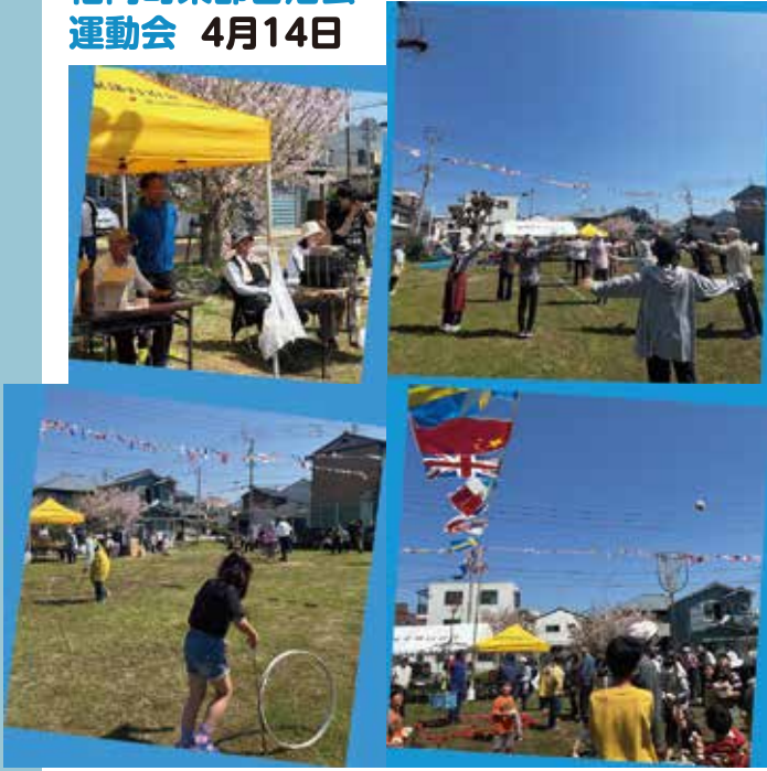
福岡町東部自治会 運動会 4月14日